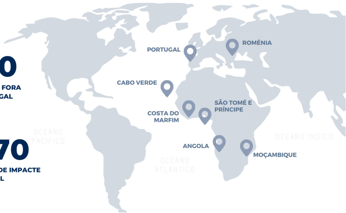
● N° Trabalhos MF&A Portugal